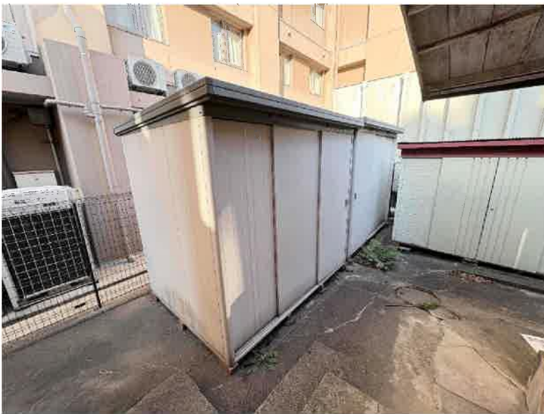
② 1台あたり 高さ 2.5 m × 横幅 2.5 m × 奥行 1.9 m