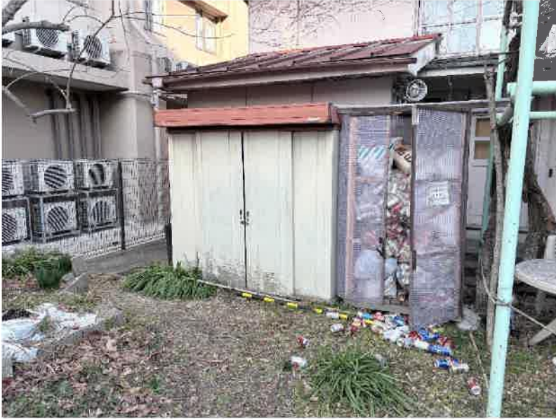
① 高さ 2 m × 横幅 2 m × 奥行 0.9 m