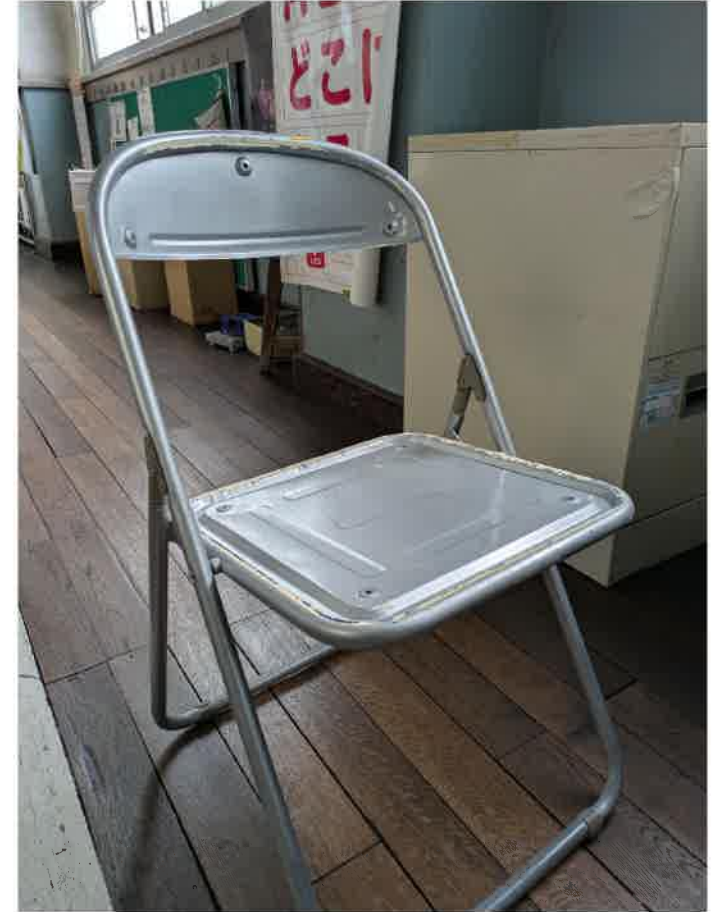
折たたみパイプ椅子