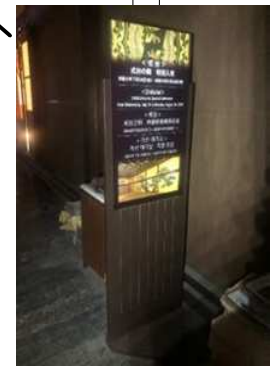
帳台の間解説看板