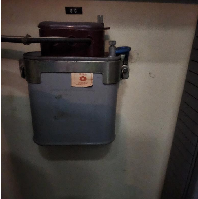
低圧コンデンサ（1基）※銘板消失