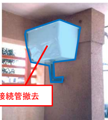
ハイタンク及び接続管撤去