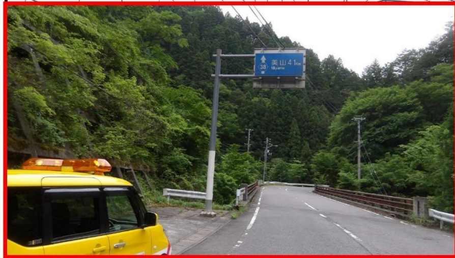
業務箇所 (広河原下之町)