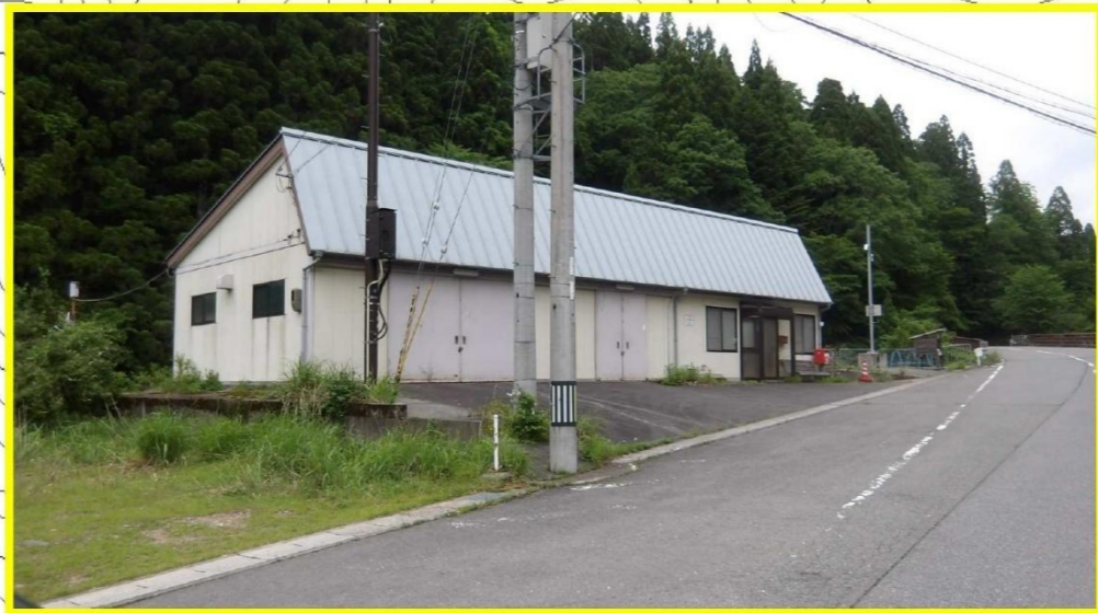
材料置場 (広河原詰所)