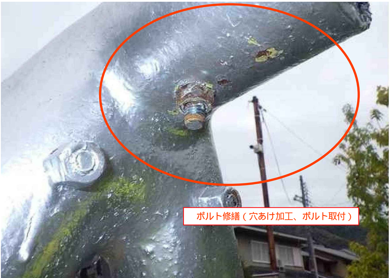
ボルト修繕 (穴あけ加工、ボルト取付)