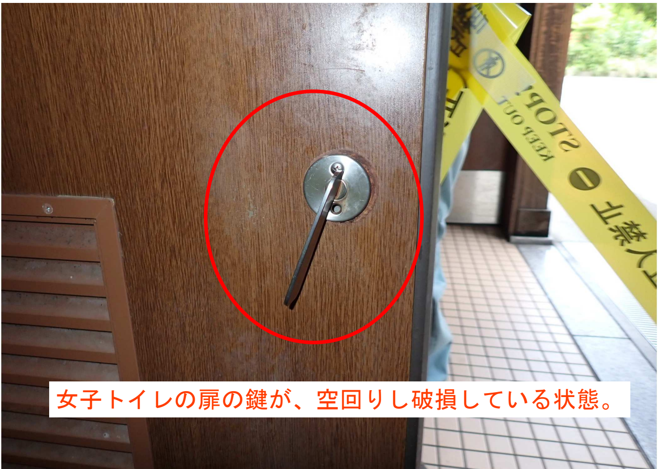
女子トイレの扉の鍵が、空回りし破損している状態。