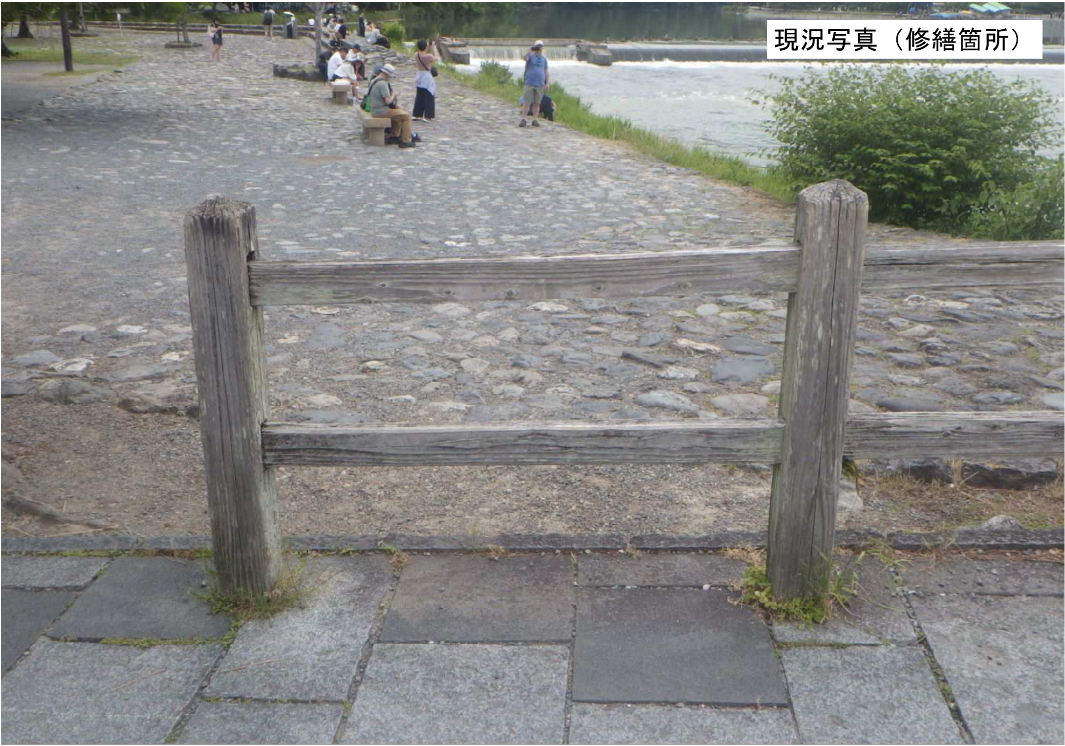
現況写真（修繕箇所）