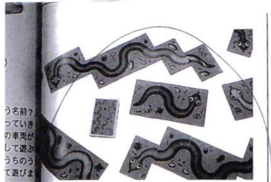
AM9921 にじいろのへび 1600円(+税) 9.5×12.5×2cm(箱) (4才から・2人~5人)

オレンジとオレンジ、青と青...1枚ずつカードをめくって、同じ色があえばカードをつなげていきます。へびを作ったり、たくさんへびを作ったり。『にじいろのへび』は何色のカードでもつなげるラッキーカード! ちょっとこわい?へびのモチーフが人気です。