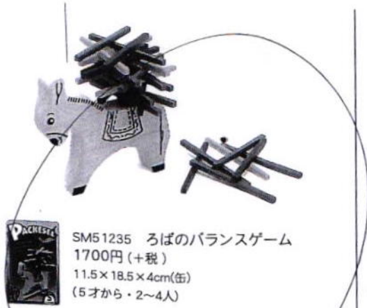
SM51235 ろばのバランスゲーム 1700円(+税) 11.5×18.5×4cm(缶) (5才から・2~4人)

体はちょっと小さいけれど、カもち。ろばがみんなの荷物を運んでくれます。カラフルな棒をバランスよく積んでいくゲーム。上手く積めたら棒はどんどん減っていきませんが、もし落としてしまうと、その棒をもらわなければなりません。いちばん最初に棒を積みきることができるのはどのプレイヤーかな?