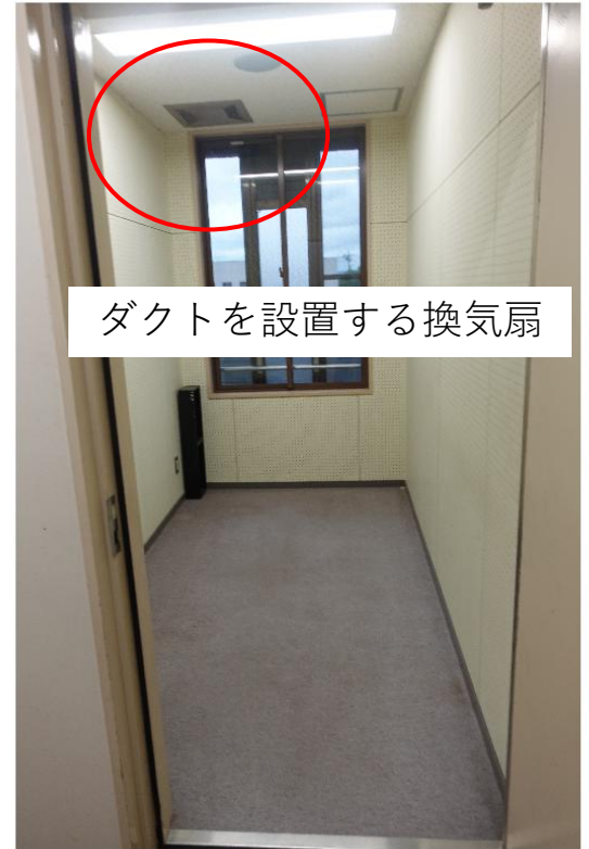
ダクトを設置する換気扇