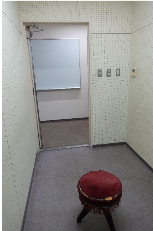
機器設置場所（赤い椅子の場所）