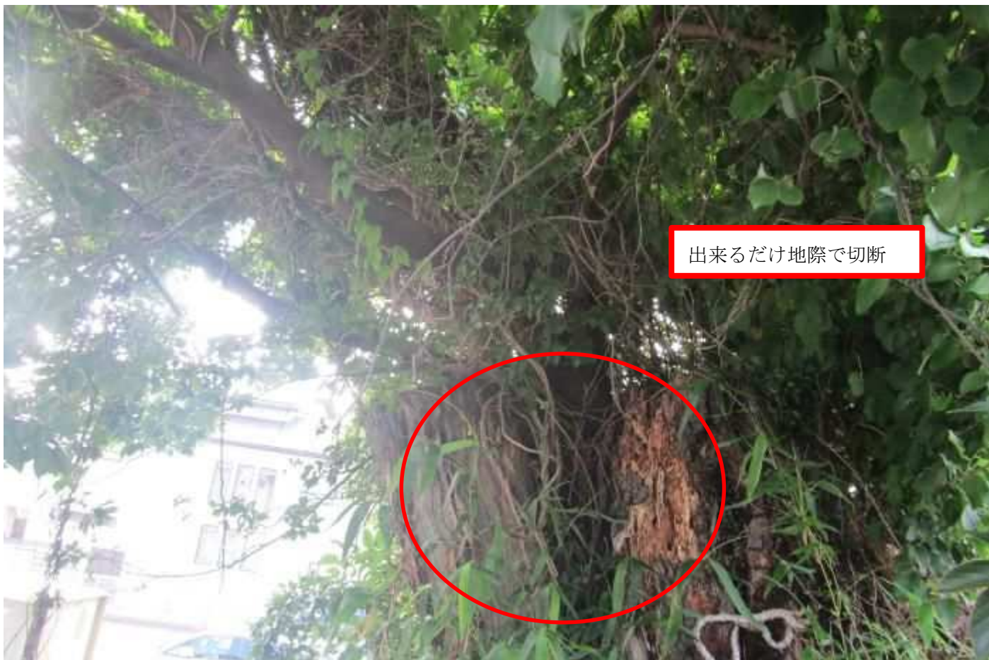
出来るだけ地際で切断