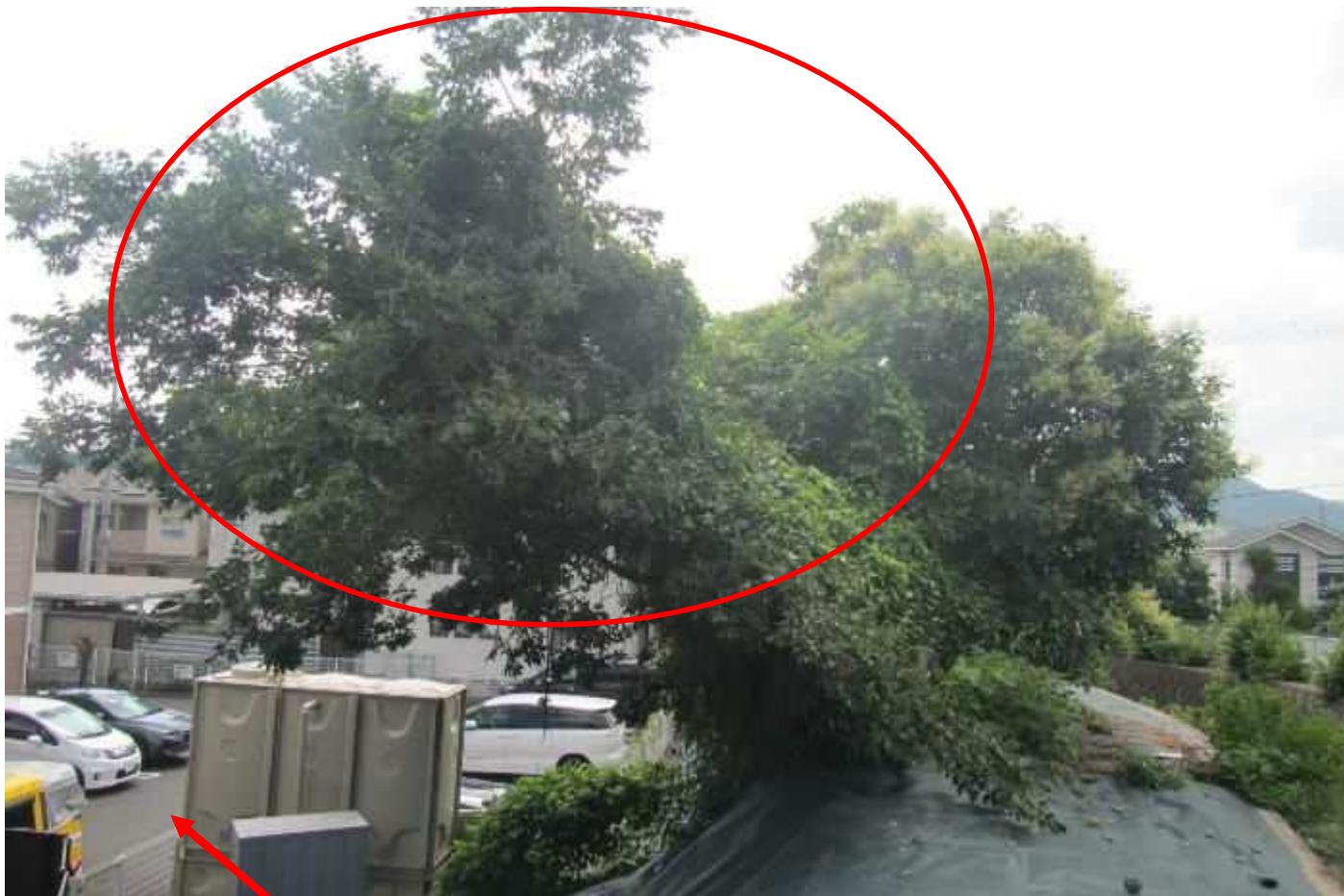
作業時 駐車場「4番、12番」使用可能