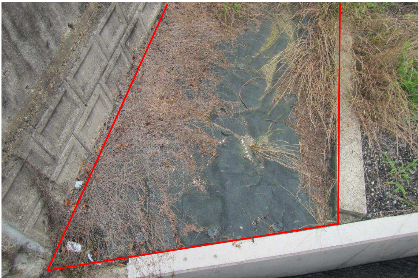
塀とコンクリートの間を 除草・防草シート修繕