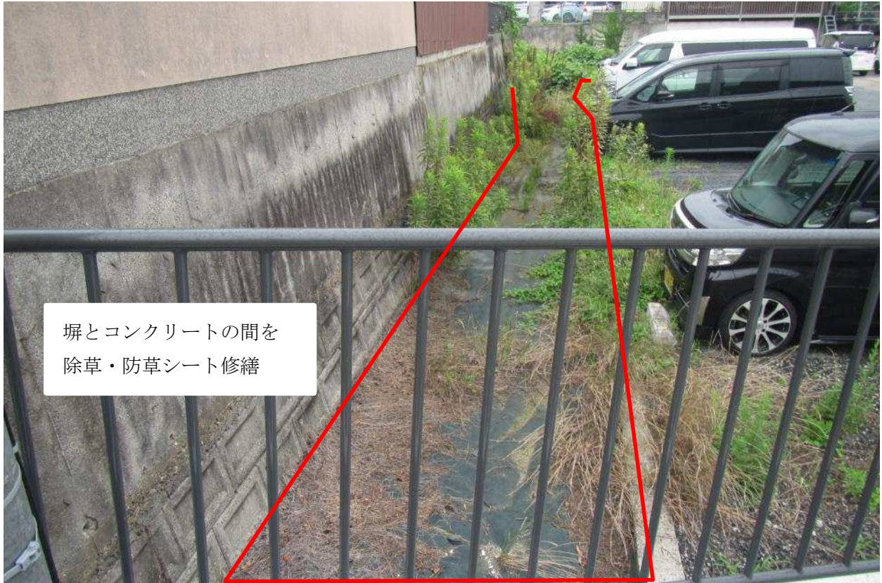
除草・防草シート修繕範囲