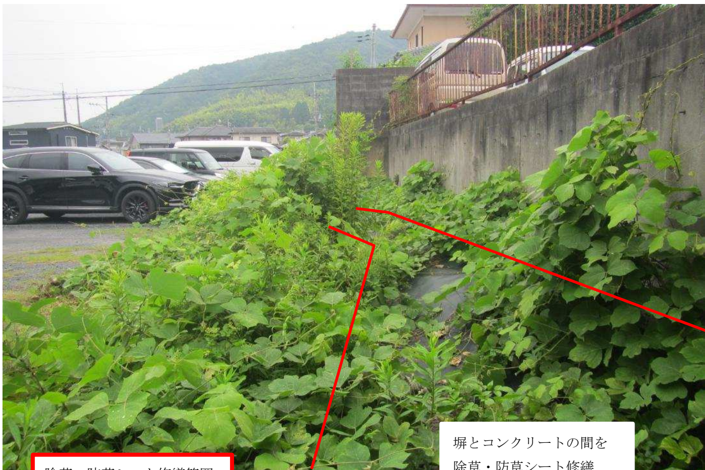
除草・防草シート修繕範囲